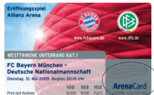
Symbol für Paymentfunktion

Die ArenaCard ist wie Bargeld. Bei Verlust der Karte, kann Ihr Guthaben nicht erstattet werden.